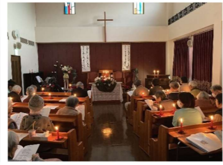
キャンドルサービス ケーキのデコレーション