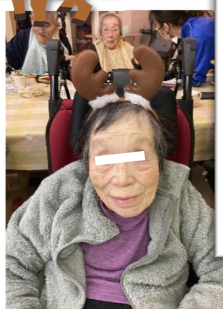
サンタさんと一緒に