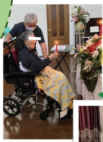
キャンドルに点火