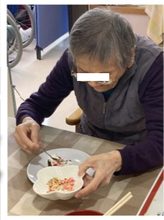
おいしそうに できました！