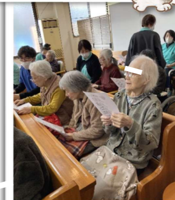
お買い物にでかけました