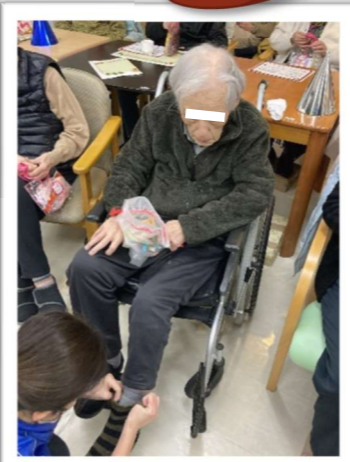
プレゼントの靴下