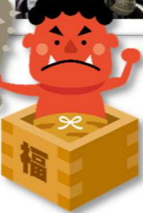
鬼のお面をかぶって